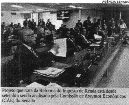
Projeto que trata da Reforma do Imposto de Renda está desde setembro sendo analisado pela Comissão de Assuntos Econômicos (CAE) do Senado

De acordo com o substitutivo do relator, deputado Celso Sabino (PSDB-PA), aprovado na Câmara, os lucros e dividendos serão taxados em 15% a título de Imposto de Renda na fonte, mas fundos de investimento em ações ficam