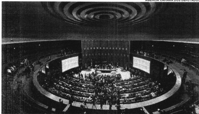
AGÊNCIA CÂMARA DOS DEPUTADOS Reformas Tributária e Administrativa são defendidas pelas lideranças governistas, enquanto Oposição quer priorizar proposta que trata da inclusão social e meio ambiente

“Temos boas perspectivas. O Congresso é reformista, e o governo está muito otimista este ano para que a gente possa