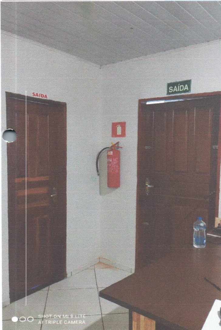
SHOT ON MI 9 LITE AI TRIPLE CAMERA