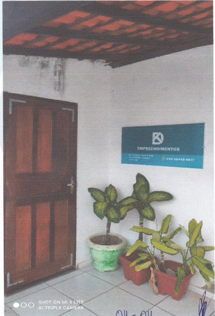
SHOT ON MI 9 LITE AI TRIPLE CAMERA