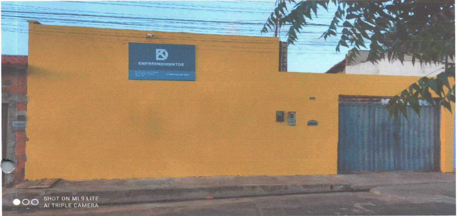
SHOT ON MI 9 LITE AI TRIPLE CAMERA

NOME EMPRESARIAL: DT EMPREENDIMENTOS E SERVICOS EIRELI