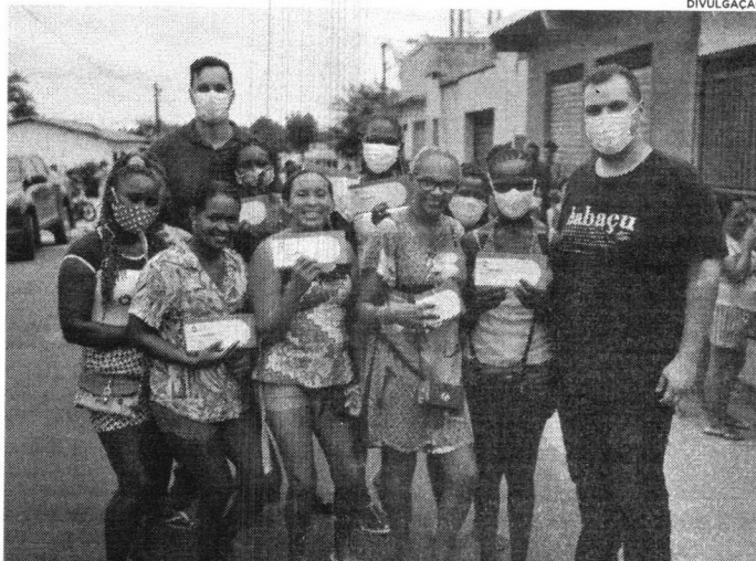
Entrega de cartões vale-alimentação em comunidade quilombola, no município de Central