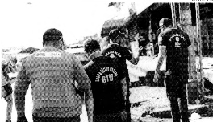
Fiscais da Blitz Urbana percorreram diversos bairros da Área Itaqui-Bacanga, para fazer valer as regras do lockdown

As equipes da Blitz Urbana estão em campo diariamente fazendo um trabalho extensivo de fiscalização que é de suma importância ao combate à propagação da curva de contágio do coronavírus, já que estamos fazendo cumprir os decretos com regras de funcionamento de serviços apenas essenciais e também orientando a forma de como proceder o distanciamento social em feiras e mercados e nos comércios autorizados a funcionar nesse período. Seguindo orientação do prefeito Edivaldo já atingimos as principais avenidas da cidade e dezenas de bairros tradicionalmente comerciais conseguindo boa aceitação das medidas e o trabalho de conscientização tem sido o foco principal. Acreditamos que apenas com a ajuda de todos e consciência do bem coletivo poderemos ultrapassar esse momento de forma mais célere